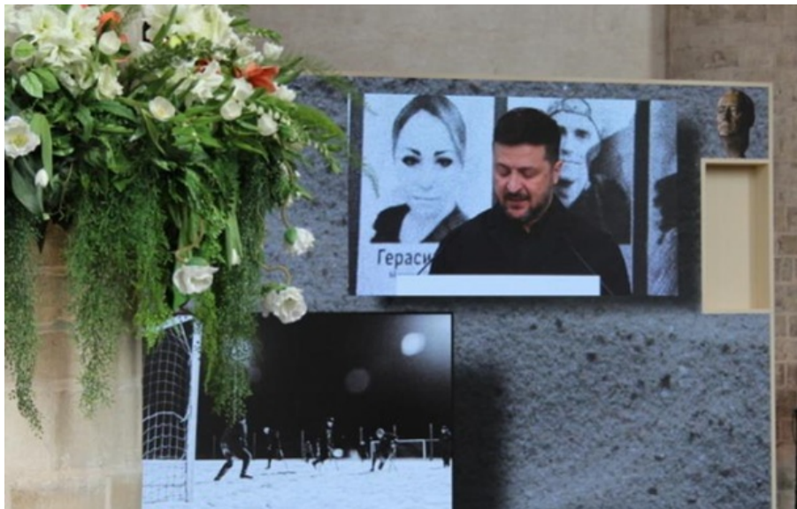
Зеленський подякував за нагороду

Премію Зеленському вручив прем'єр-міністр Нідерландів Роб Єттен. У церемонії також узяли участь король Нідерландів Віллем-Александр і його мати принцеса Беатрікс.