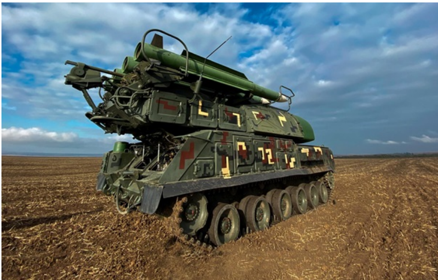
Зенітна ракетна установка Бук

Зафіксовано влучання 17 ударних дронів на 10 локаціях, а також падіння уламків ще у трьох місцях.