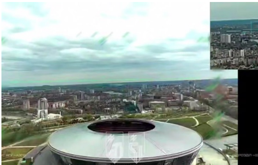
Український дрон над Донбас Аrenoю

На оприлюднених кадрах видно, як українські дрони літають над Донецьком поблизу стадіона Донбас Арена.