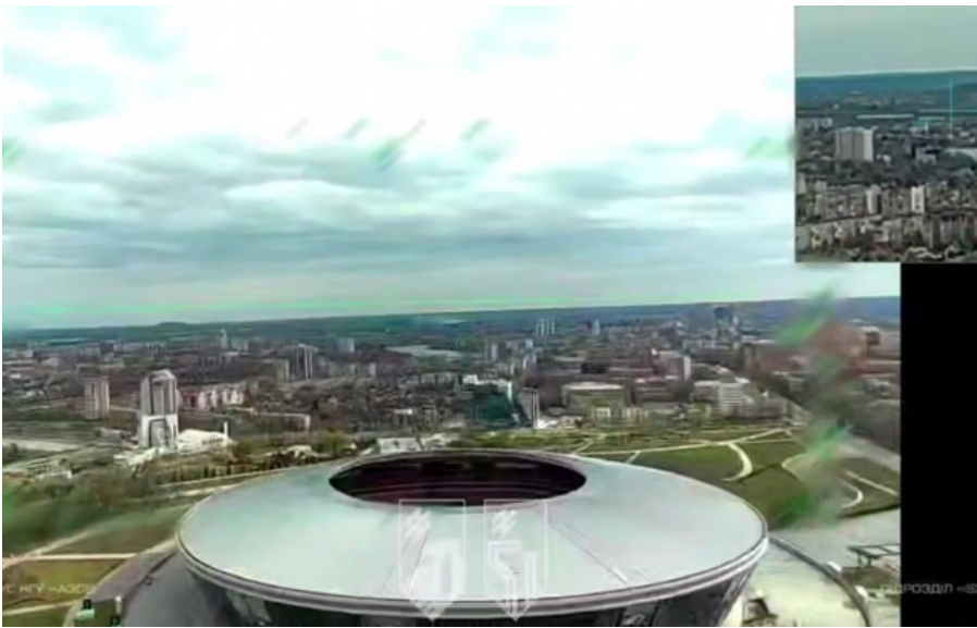
Український дрон над Донбас Аrenoю

На оприлюднених кадрах видно, як українські дрони літають над Донецьком поблизу стадіона Донбас Арена.