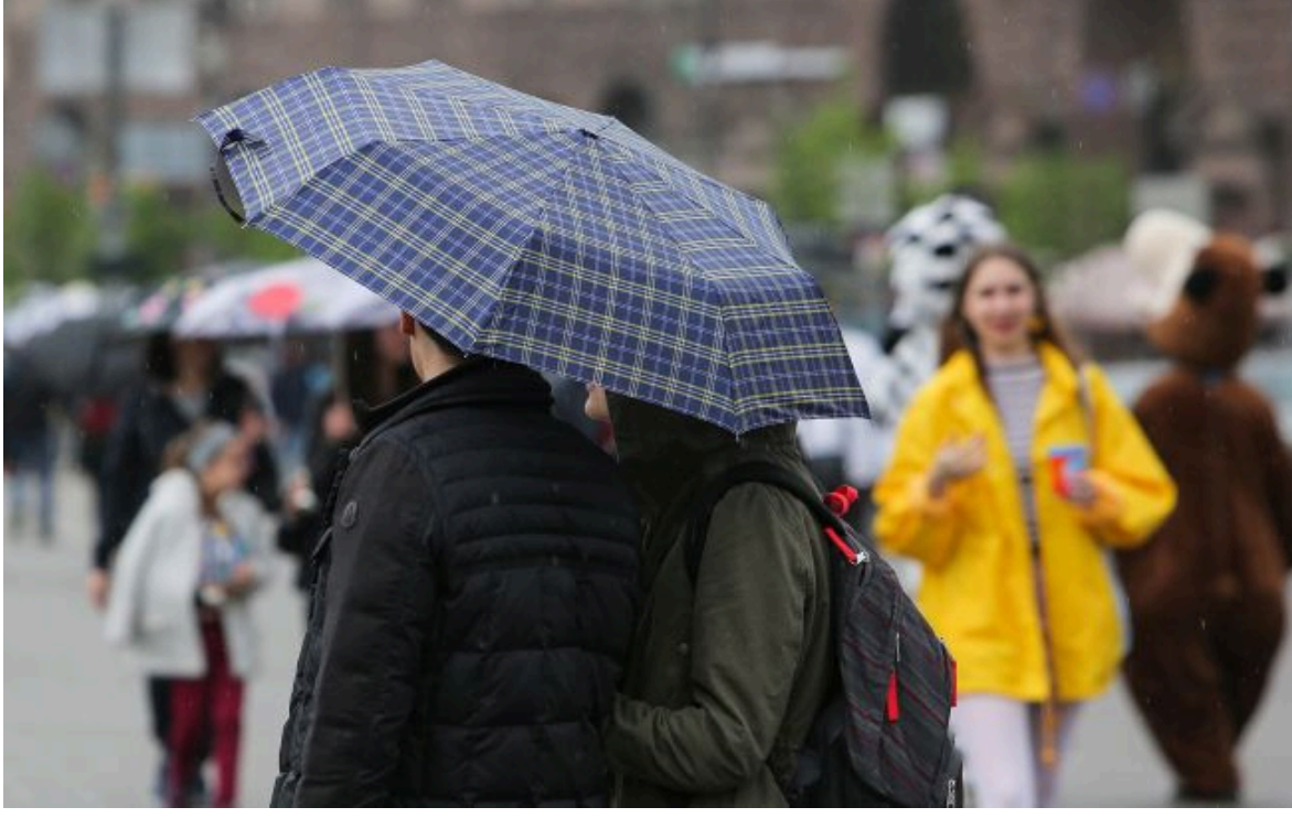
Погода в Україні завтра буде здебільшого волога