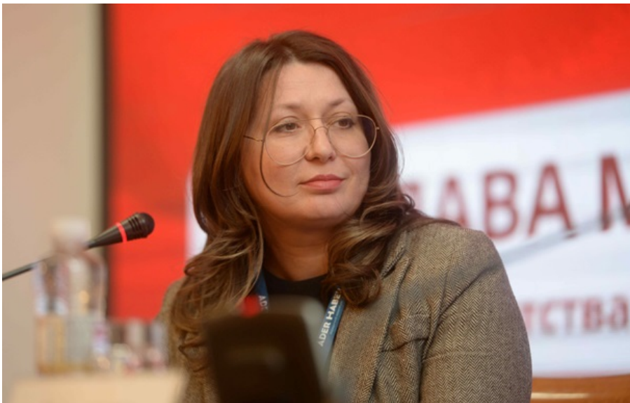
Фото: АРМА Т.в.о. АРМА Ярослава Максименко

За результатами перевірки встановлено, що доступ до внутрішніх інформаційних систем отримано не було, витік з баз даних та державних інформаційних ресурсів не відбувся.