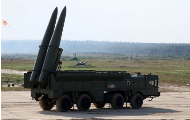
Фото: ОТРК "Іскандер" (Getty Images)

Підрозділи Сил безпілотних систем уразили дронами 16 військових цілей російських загарбників. Серед них - об'єкти базування ОТРК "Іскандер", ППО та нафтопереробний завод у Туапсе (РФ).