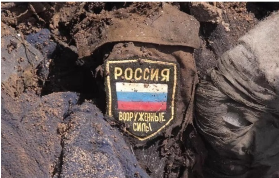
Тисячі росіян пішли на перегній в Україні

Українські військові знищили понад 2700 одиниць російської техніки, серед якої 61 гармата і три РСЗВ.