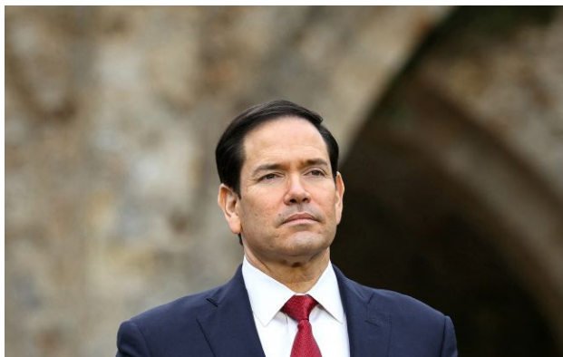
Фото: державний секретар США Марко Рубіо

Обирайте перевірене - додайте РБК-Україна до улюблених джерел у Google