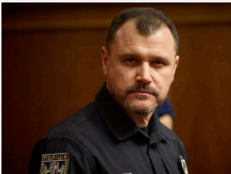
Пістолети для цивільних: Глава МВС Клименко анонсував закон про право на озброєний захист

Після вчорашнього розстрілу в Києві глава МВС Клименко заявив, що громадяни повинні мати «права на озброєний захист».