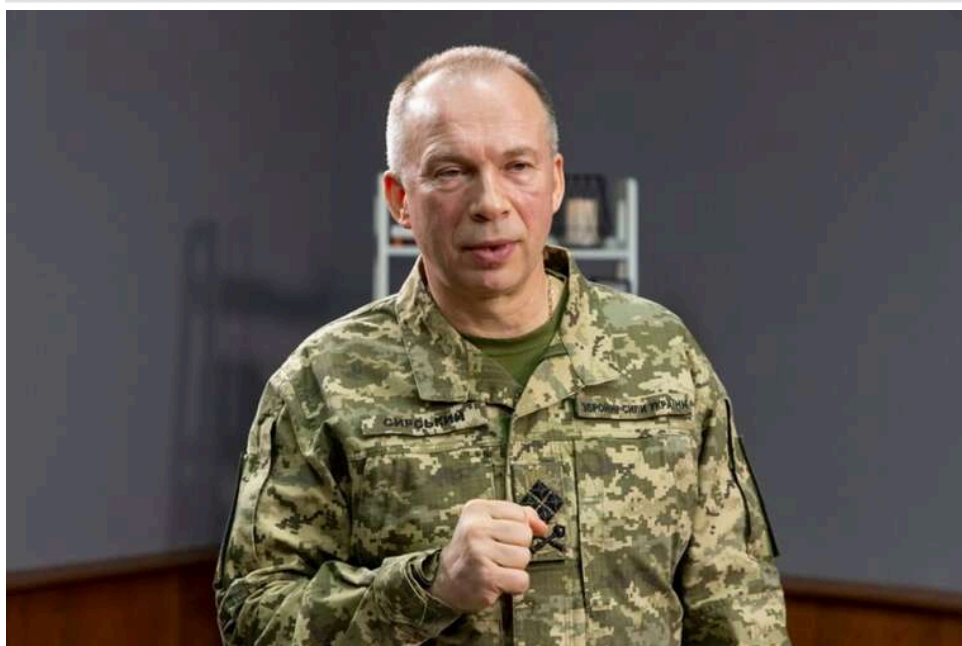
Технології, чисельність та економіка: Сирський назвав три ключові напрямки боротьби з РФ у сфері БпС

Наразі в українських військових триває змагання з російськими окупантами за трьома напрямками.