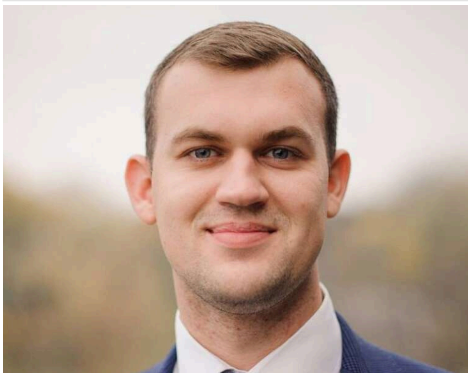
Cardano, BMW X3 та мільйони від ФОП: статки головного цифрового реформатора ДПС Ігоря Панченка

Заступник голови ДПС з питань цифрового розвитку, цифрової трансформації та цифровізації Ігор Панченко прибув до столиці з Полтави, де обіймав посаду заступника голови військової адміністрації