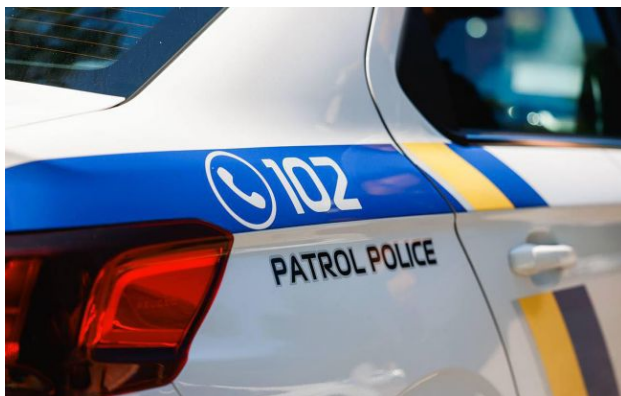
Фото: бійка через шум, поліція встановлює деталі події (facebook.com/zaporizhiapolice)

Обирайте перевірене - додайте РБК-Україна до улюблених джерел у Google