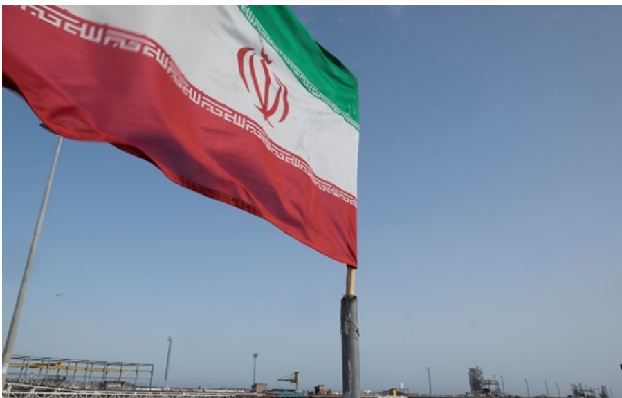
Іранська нафта пішла в Індію