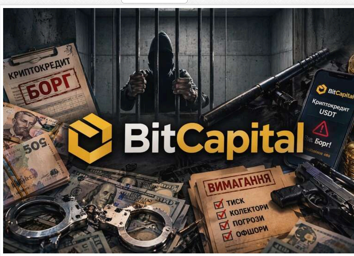
BitCapital – чому правоохоронні органи не можуть знайти бенефіціарів

Читати на руськом Read in English Додати на бачок