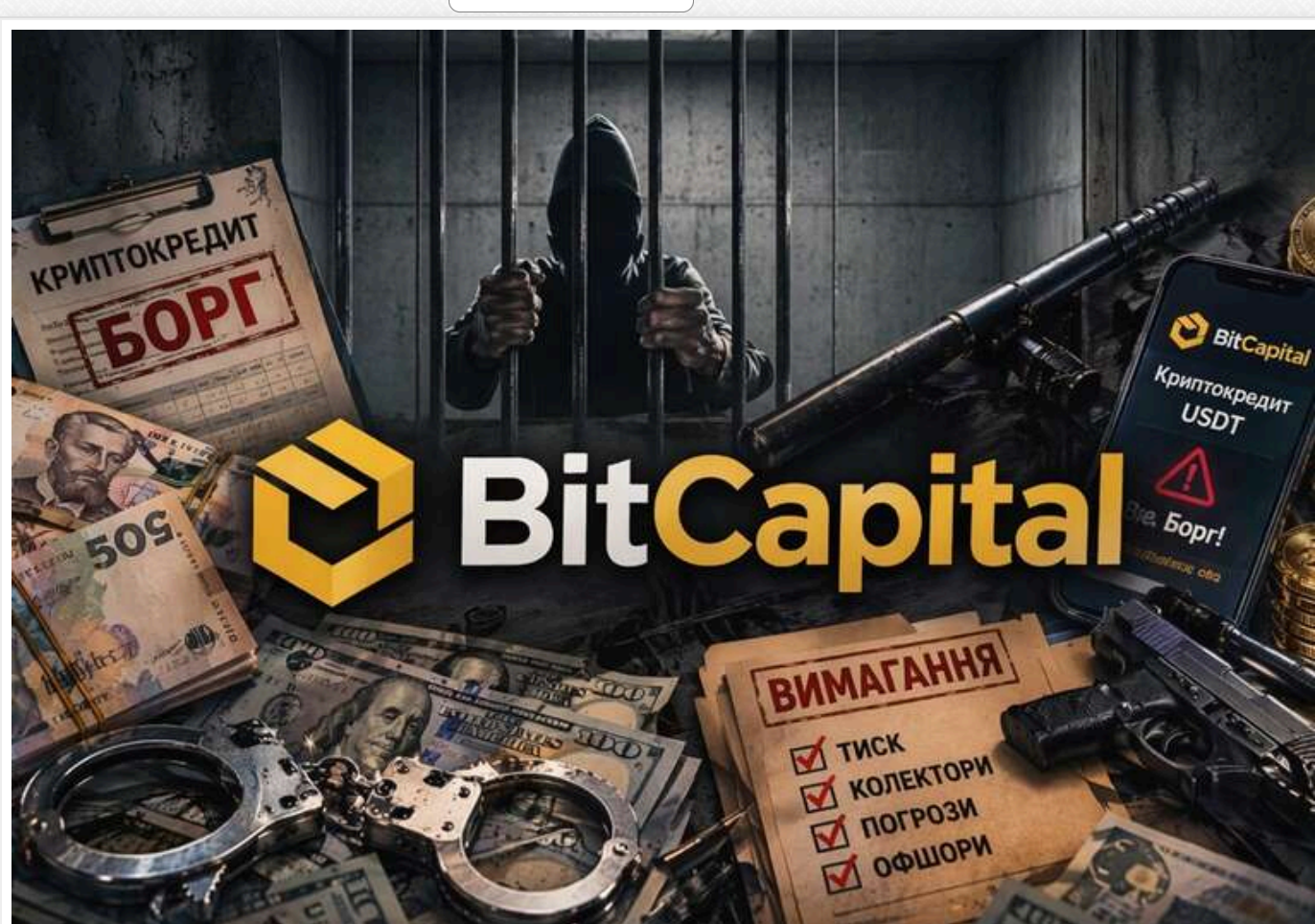
BitCapital – чому правоохоронні органи не можуть знайти бенефіціарів

Читати на руском Read in English Додати на бачок