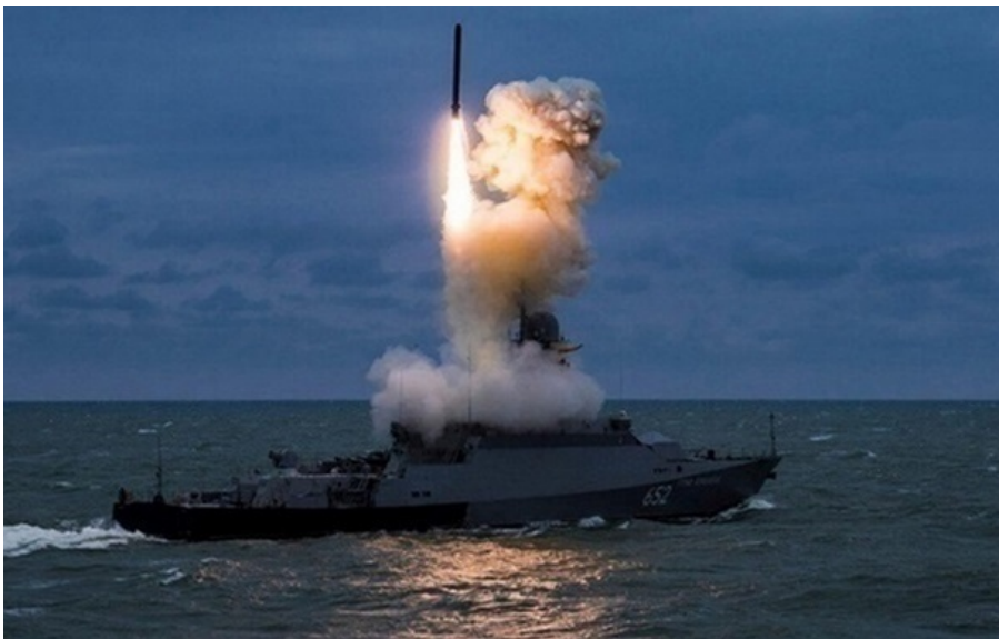
Фото: Міноборони РФ (ілюстративне фото) ЗСУ уразили російський носій "Калібрів"

Також уражено сторожовий катер, танкер тінювого нафтового флоту. Інфраструктура нафтоналивного порту країни-агресорки теж зазнала значних ушкоджень.