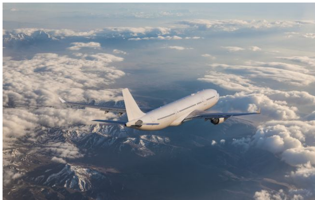
Фото: пасажирський літак (Getty Images)

Обирайте перевірене - додайте РБК-Україна до улюблених джерел у Google