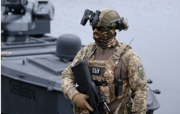
Фото: Сили оборони уразили російський ракетний корабель "Каракурт" (Віталій Носач, РБК-Україна)

Обирайте перевірене - додайте РБК-Україна до улюблених джерел у Google