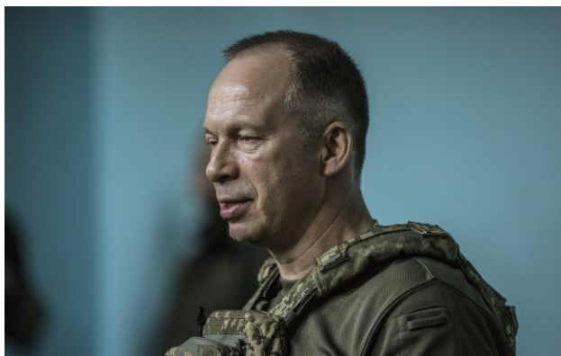
фото: головнокомандувач ЗСУ Олександр Сирський (Getty Images)

Обирайте перевірене - додайте РБК-Україна до улюблених джерел у Google