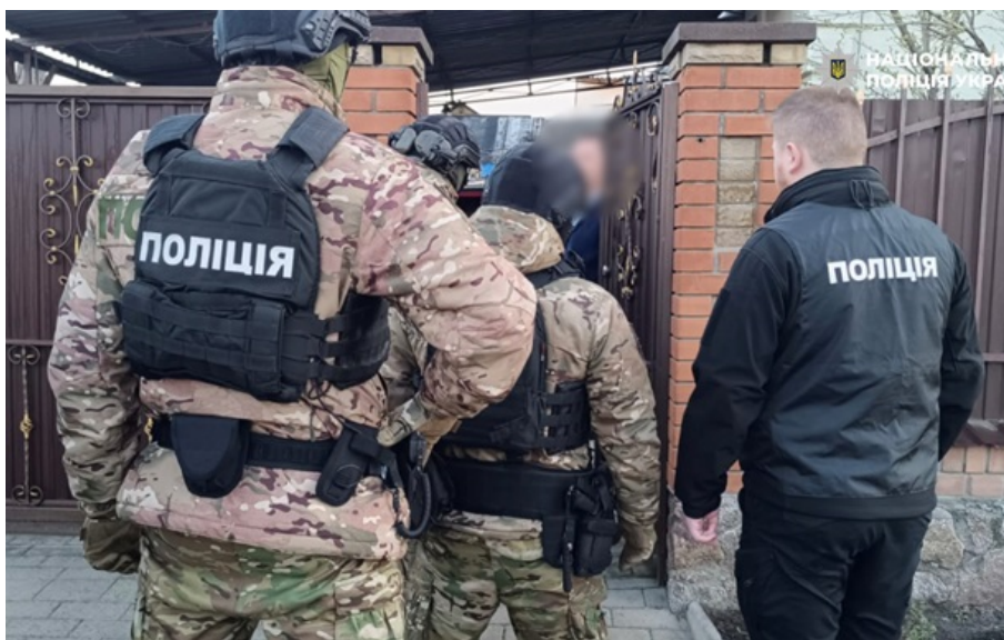
Нацполіція викрила організовану групу, яка роками привласнювала квартири померлих та одиноких громадян

Схема була чітко організована, а мішенню шахраїв ставали квартири, власники яких померли, спадкоємці відсутні або не встигли оформити права.