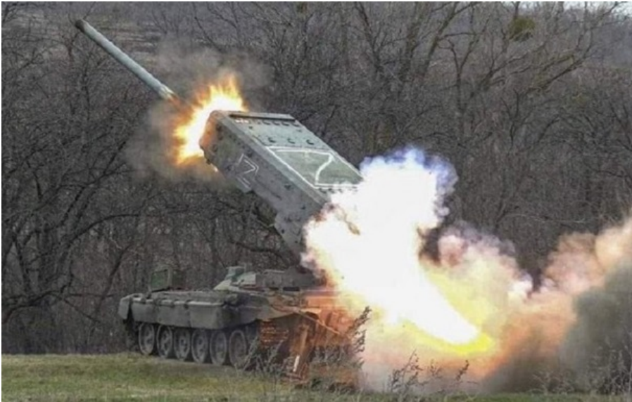
Уражено важку вогнеметну систему противника типу Солнцепьок

Ще одна відмінусована одиниця важкої техніки противника, що зазвичай перебуває під посиленням прикриттям і захистом засобів РЕБ.