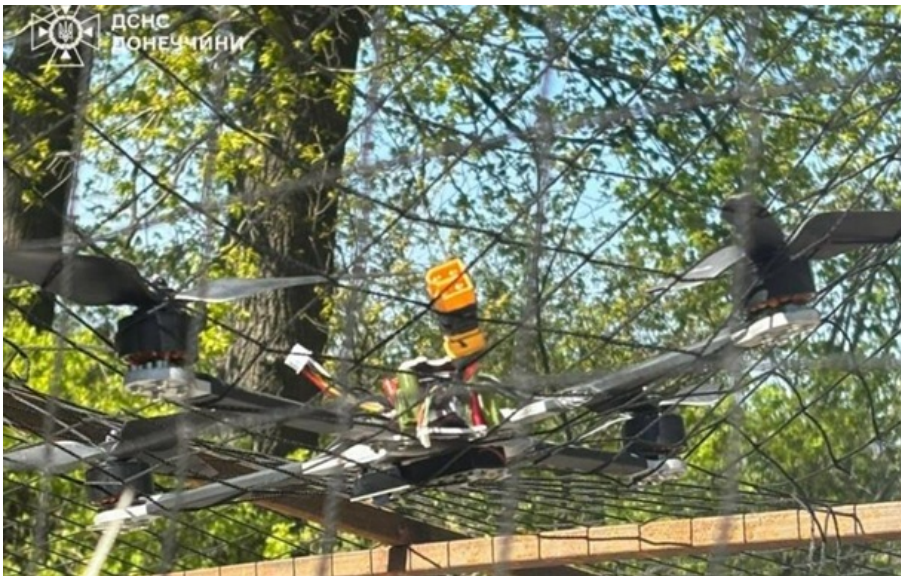
На Донеччині росіяни атакували дроном рятувальників

За останні п'ять днів це вже друга російська атака на групу Фенікс, здійснена під час порятунку цивільних.