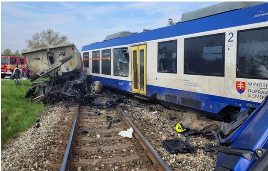
У Словаччині пасажирський потяг зіткнувся з вантажівкою

Внаслідок зіткнення загинув водій вантажівки. 3 пасажирів потяга постраждала 21 людина.