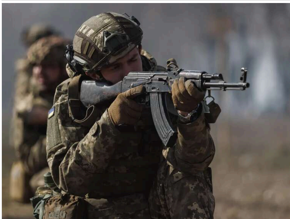
Ситуація на фронті: Зафіксовано 51 боєзіткнення, з них 30 - на Покровському і Гуляйпільському напрямках