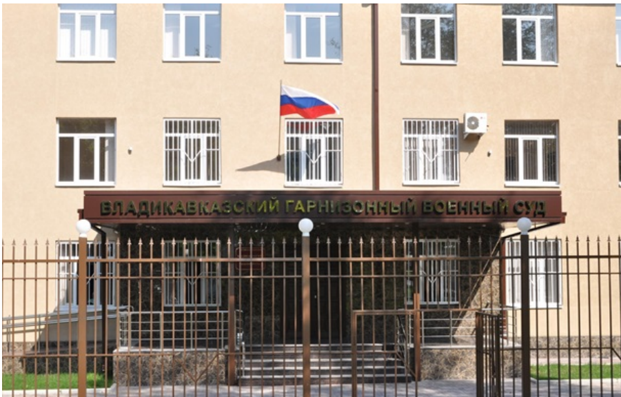
(ілюстративне фото)

Кількість вироків, пов'язаних з військовослужбовцями, значно зростає з початку війни проти України