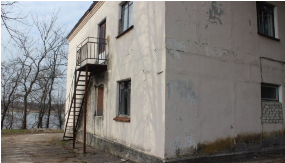
В такому стані було придбано піонерський табір «Дружба»

Для заволодіння державними коштами зловмисники викупили корпоративні права на товариство з обмеженою відповідальністю, яке володіло дитячим табором на Кіровоградщині.