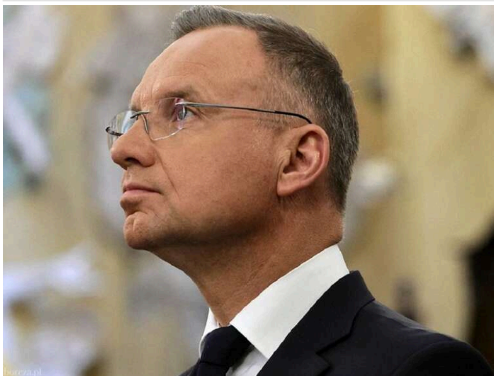
Війна може закінчитися до 2028 року: експрезидент Польщі Дуда про роль США та майбутнє України

Експрезидент Польщі Анджей Дуда висловив думку, що конфлікт в Україні може завершитися до 2028 року – до кінця президентського терміну Дональда Трампа. За його словами, саме США здатні відіграти ключову роль у припиненні бойових дій, про це він розповів у розмові з Гордоном.