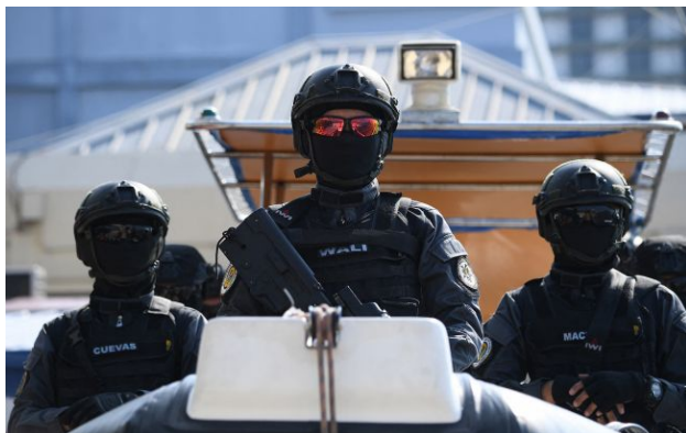
Фото: співробітники берегової охорони Філіппін

Обирайте перевірене - додайте РБК-Україна до улюблених джерел у Google