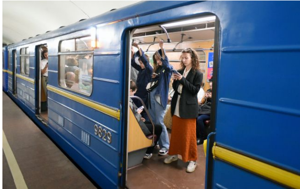
Фото: у метрополітені підтвердили смерть

Обирайте перевірене - додайте РБК-Україна до улюблених джерел у Google