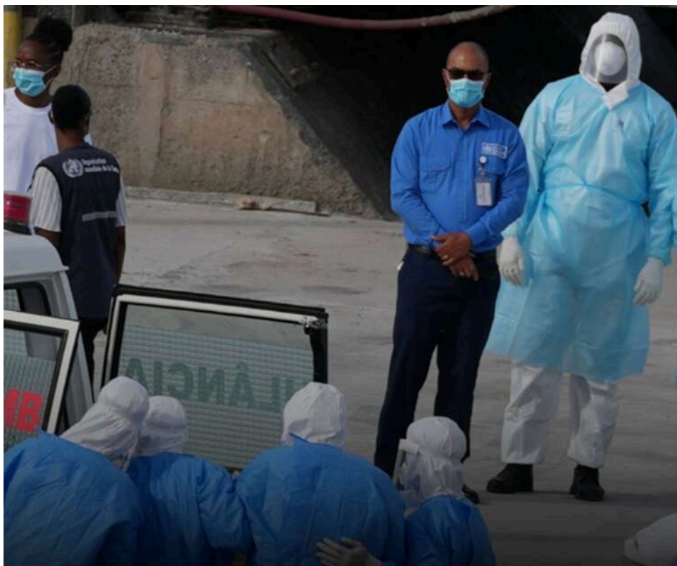
Хантавірус дістався Польщі: під спостереження взяли першу особу через контакт із зараженою пасажиркою

У Польщі взяли під нагляд першу людину, яка, можливо, контактувала з пасажиркою круїзного лайнера MV Hondius, зараженою хантавірусом.