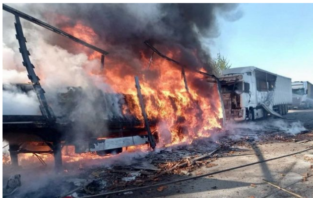
Фото: Росія ударила по АЗС і зачепила автобус з дітьми на Дніпропетровщині (t.me/dnipropetrovskaODA)

Обирайте перевірене - додайте РБК-Україна до улюблених джерел у Google