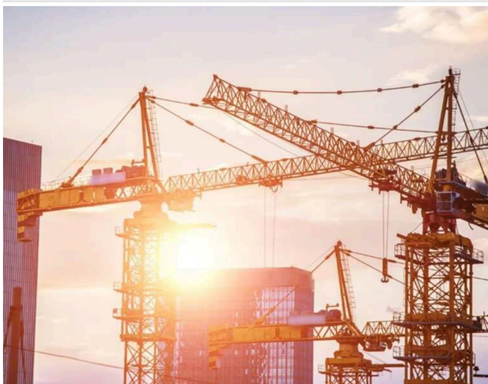
Заборгував 2 мільйони: в Калуші судять забудовника за несплату пайового внеску

У Калуші подали до суду позов щодо стягнення з забудовника близько 2 мільйонів гривень несплаченої пайової участі за будівництво багатоквартирного будинку.