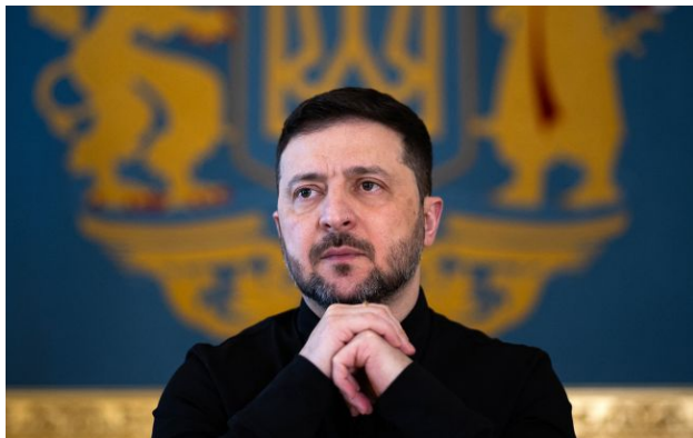
Фото: Володимир Зеленський (Getty Images)

Україна рухається до умов, коли матиме змогу виробляти протиповітряну оборону. Йдеться про всі необхідні формати ППО - системи, ракети тощо.