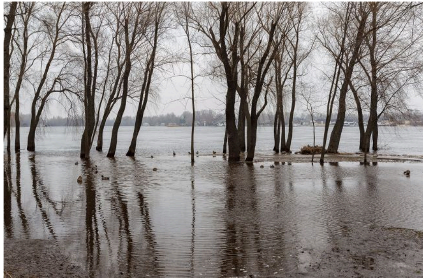
Весняне водопілля може бути небезпечним

Обирайте перевірене - додайте РБК-Україна до улюблених джерел у Google