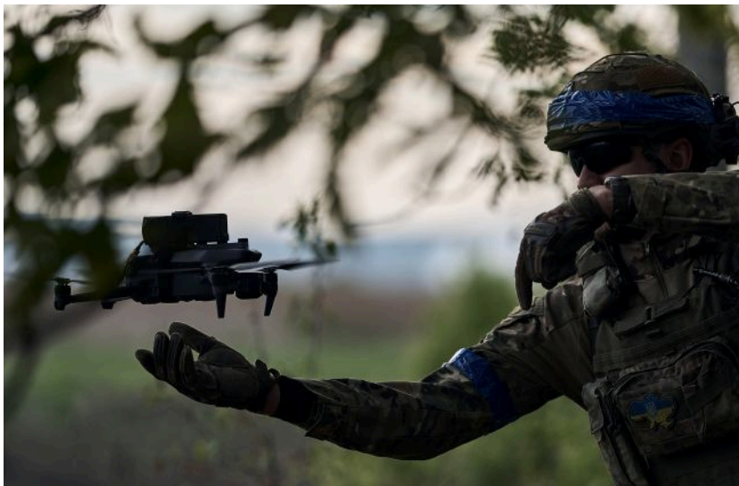
Фото: українські військові контролюють тил російських окупантів (Getty Images)