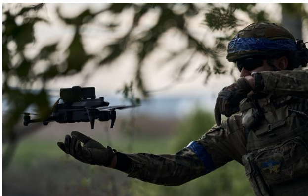
Фото: українські військові контролюють тил російських окупантів

Обирайте перевірене - додайте РБК-Україна до улюблених джерел у Google