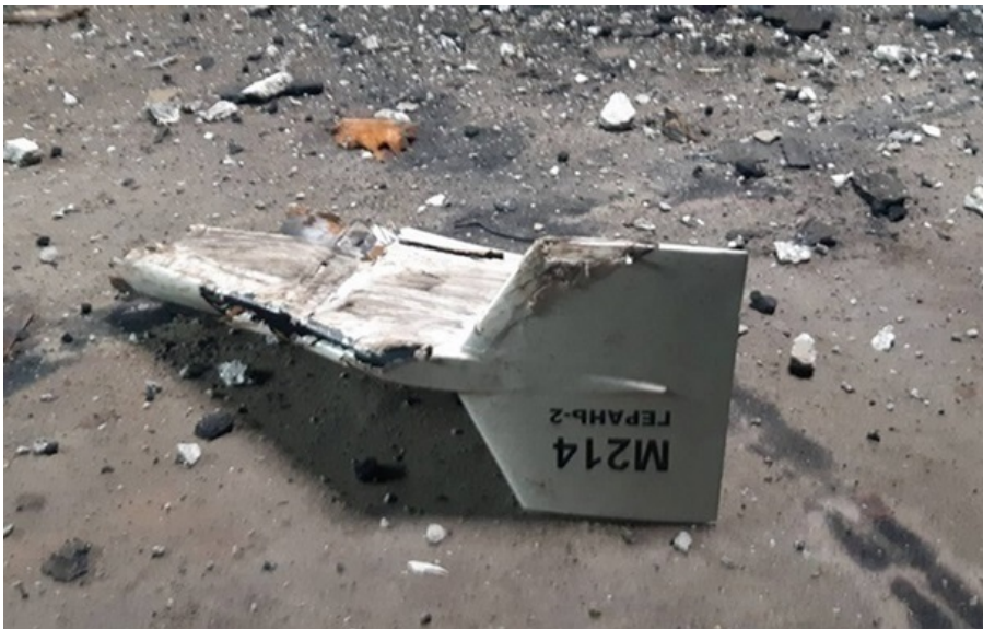
Фото: Соцмережі (ілюстративне фото) Сили ППО знешкодила 249 із 268 дронів РФ

Зафіксовано влучання балістичної ракети та 19 ударних БПЛА на 15 локаціях, а також падіння збитих (уламки) на 1 локації.