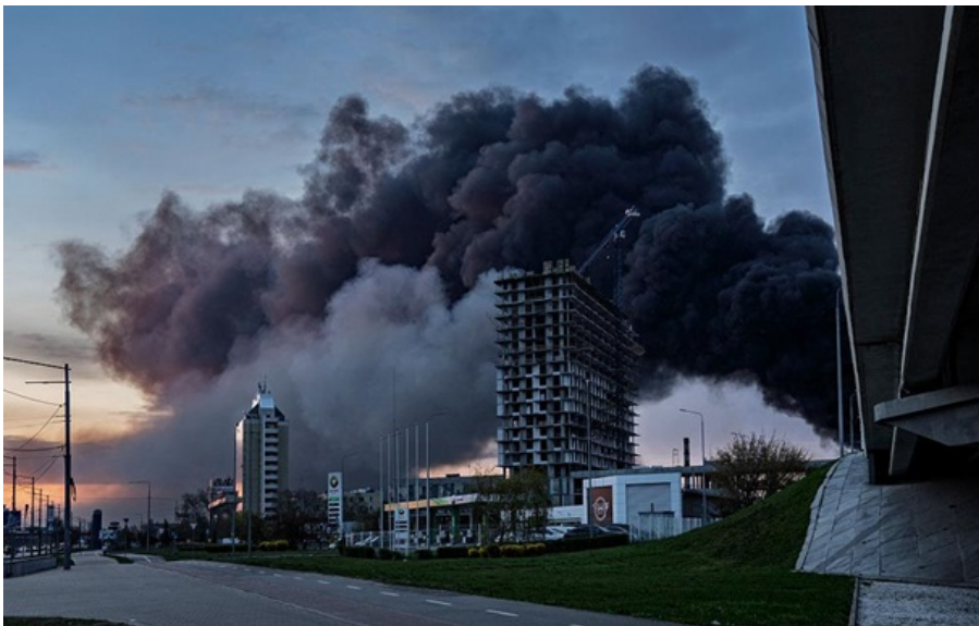
Дим від пожежі в Києві після атаки Росії 16 квітня