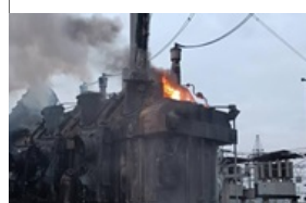
Відключення у дев'яти областях після атаки РФ Вчора, 10:37