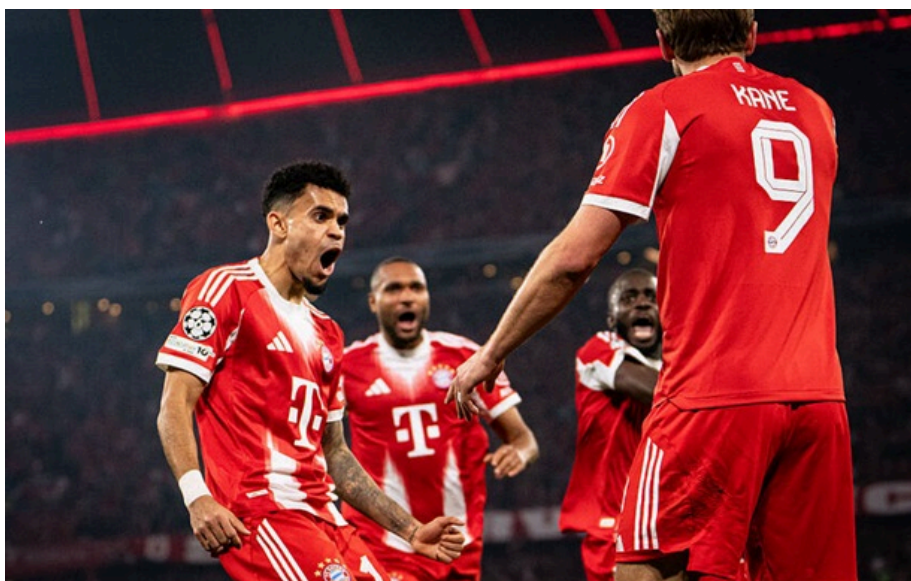
Гравці Баварії

Німецький клуб став другою командою в історії проведення Ліги чемпіонів, якій удалося, програвши, кожного разу зрівнюватися із суперником за забитими голами і в кінцевому підсумку виграти протистояння.