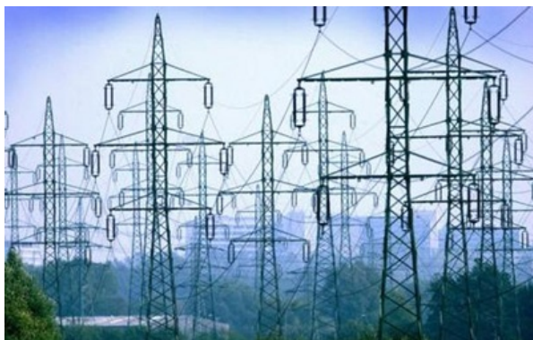
Енергетика не повинна використовуватися як інструмент політичного тиску - заява G-7

Голови енергетичних відомств G-7 вважають, що необхідна більш широка стратегія енергетичної безпеки для "глобальних енергетичних ринків".