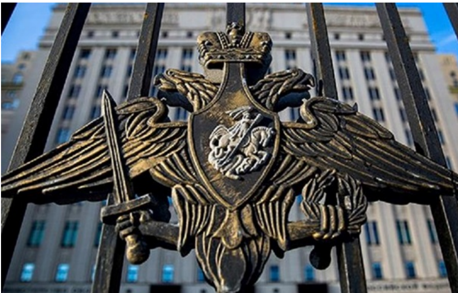
Фото: Міноборони РФ (ілюстративне фото) Міноборони РФ пригрозило Європі через дрони для України

Міноборони РФ опублікувало адреси європейських компаній, які нібито роблять дрони для України.