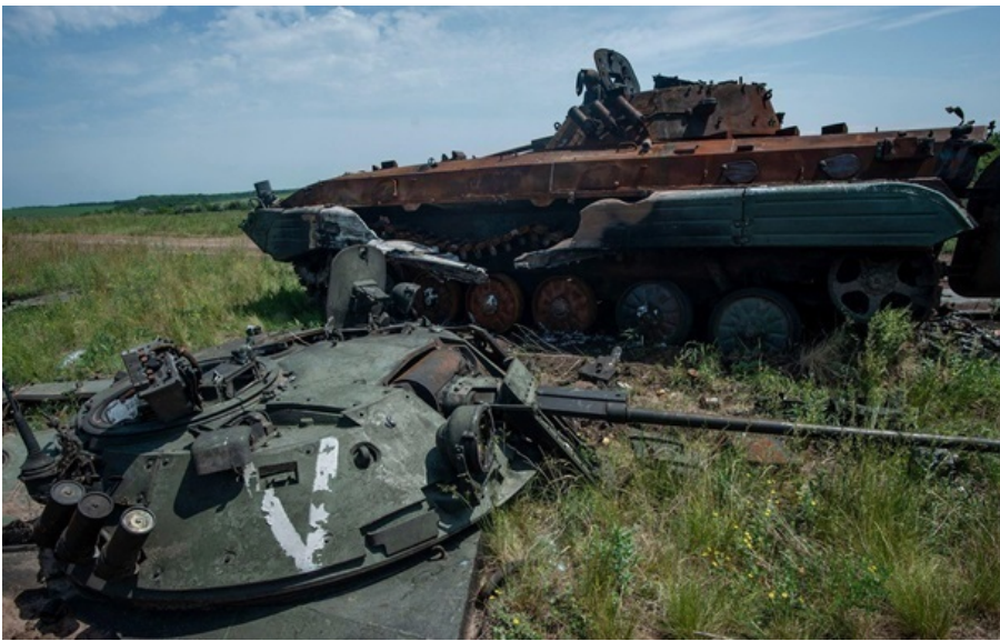
Генштаб підрахував нові втрати РФ

Загальні бойові втрати російських окупантів з 24.02.22 по 03.05.26 орієнтовно склали близько 1 334 030 осіб.