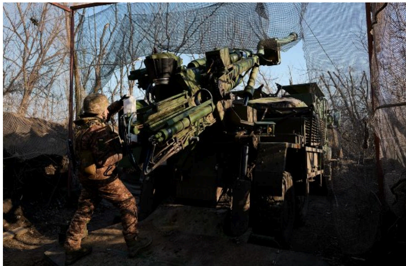
Фото: українська артилерія (Getty Images)