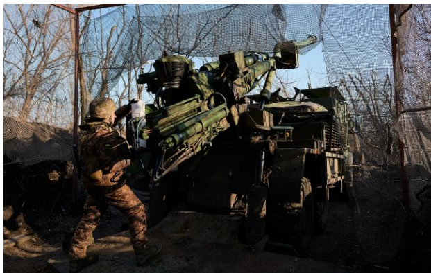
Фото: українська артилерія (Getty Images)

Обирайте перевірене - додайте РБК-Україна до улюблених джерел у Google