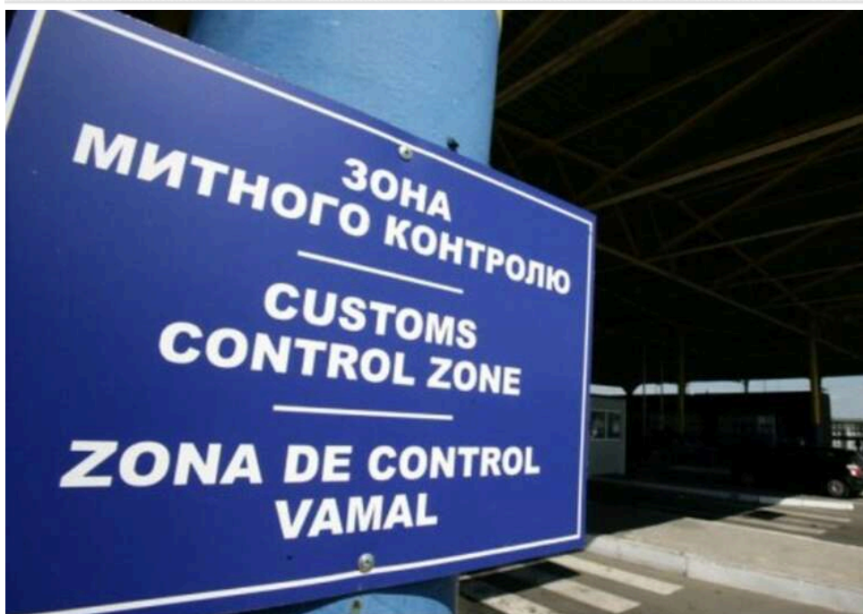
Мільйонна афера на митниці: волинський бізнесмен заплатить понад 4,7 мільйона гривень штрафу за "липові" польські документи

Любомльський районний суд Волинської області виніс рішення у справі № 163/2296/25 про масштабне ухилення від сплати митних платежів. Колишній директор підприємства намагався зекономити на податках, використовуючи підроблені польські сертифікати про походження товарів.