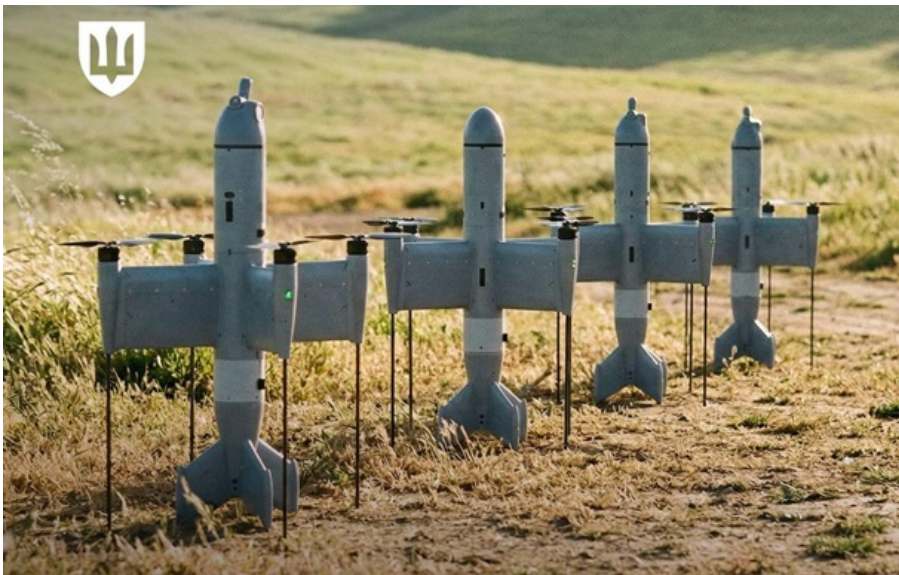
Дрони-перехоплювачі Ostorus успішно нищать "шахеда"

Володимир Зеленський провів важливу розмову з Робертом Фіцо, а сили ППО знищили сотні "шахедів". Кореспондент.net виділяє головні події вчорашнього дня.