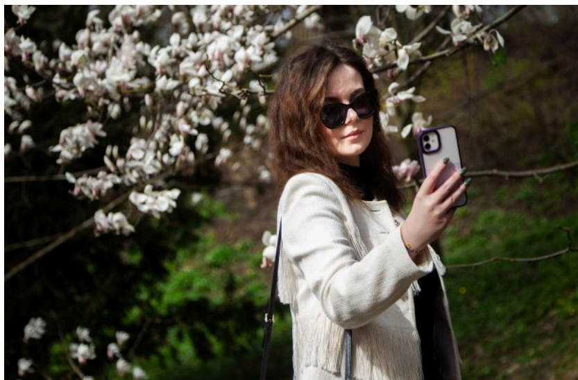
Фото: синоптики дали прогноз погоди на 3 травня