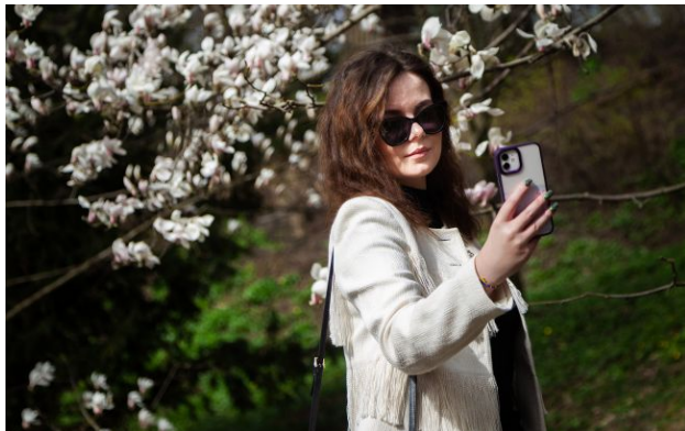
Фото: синоптики дали прогноз погоди на 3 травня

Обирайте перевірене - додайте РБК-Україна до улюблених джерел у Google