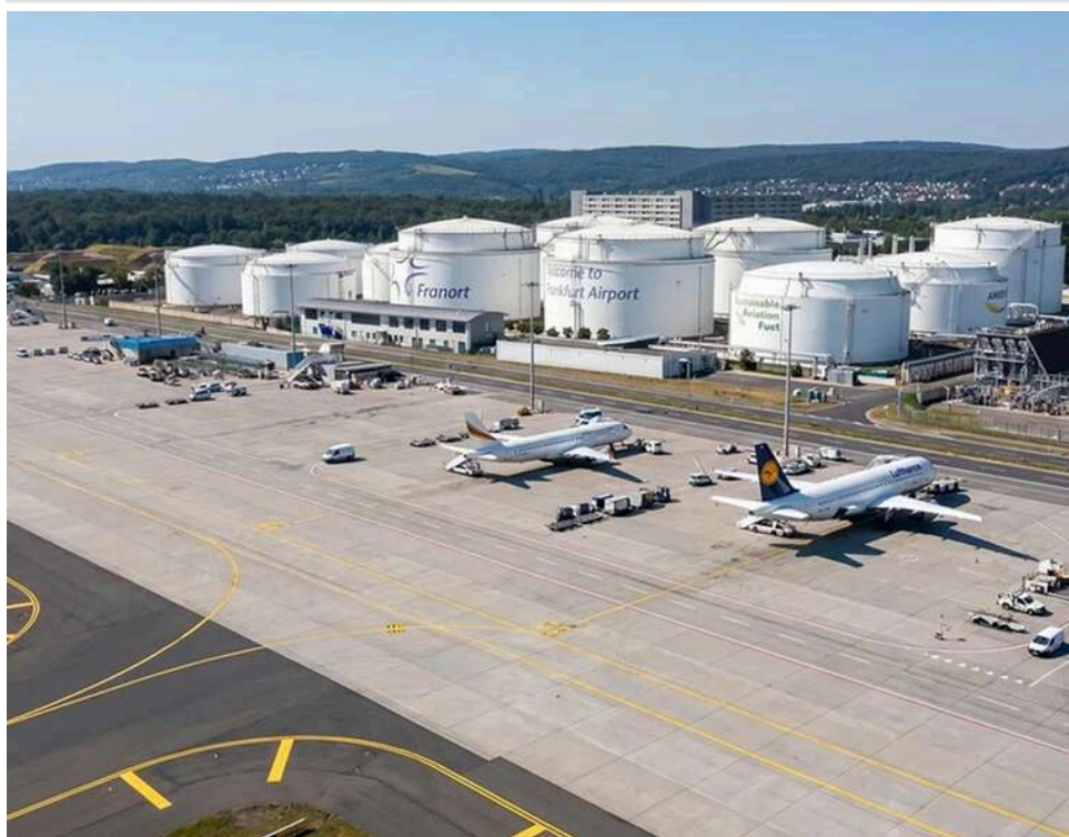
Під загрозою 20 мільйонів пасажирів: через дефіцит пального в Німеччині готуються до масового скасування авіарейсів

Близько 20 мільйонів авіапасажирів у Німеччині можуть постраждати від скасування рейсів через нестачу керосину, повідомляє німецьке видання WELT з посиланням на главу асоціації німецьких аеропортів Ральфа Байзеля.